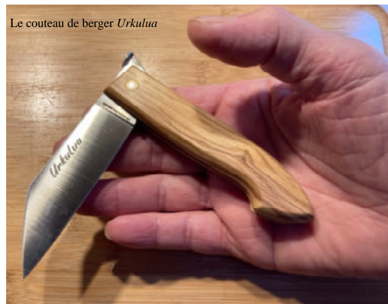
Le couteau de berger Urkulua

EDM : Oui, et je n'en suis pas peu fier bien que je n'ai rien fait à l'exception de fouiller le dépotoir de cette cabane de la période Moderne. Ce sont les ateliers des Couteliers Basques de Bidart, sous la direction de Paskal EXPOSITO, qui ont réalisé cette belle ouvrage. C'est un couteau magnifique qui porte le nom de Urkulua . Les Couteliers Basques le proposent avec plusieurs versions de manche et deux versions de lames, l'une en carbone, l'autre en inox. C'est une réussite artisanale à partir du patrimoine archéologique. C'est immense ! Ce couteau a une histoire qui commence à la fin du XVIIe siècle et qui trouve son aboutissement dans la forge de l'atelier des Couteliers Basques à Bidart au XXIe siècle. C'est beau !