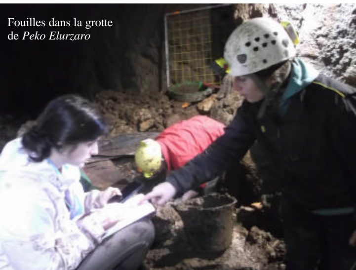
Fouilles dans la grotte de Peko Elurzaro

L'équipe d'Arkeo-Ikuska, malgré des conditions de travail difficiles, je dirais même rébarbatives, fit son job et une stratigraphie et une chronologie apparurent à notre grande satisfaction ainsi qu'une culture matérielle qui nous permit de distinguer deux grands niveaux d'occupation, l'un de la période du Bronze final, l'autre plus ancien du Néolithique final.